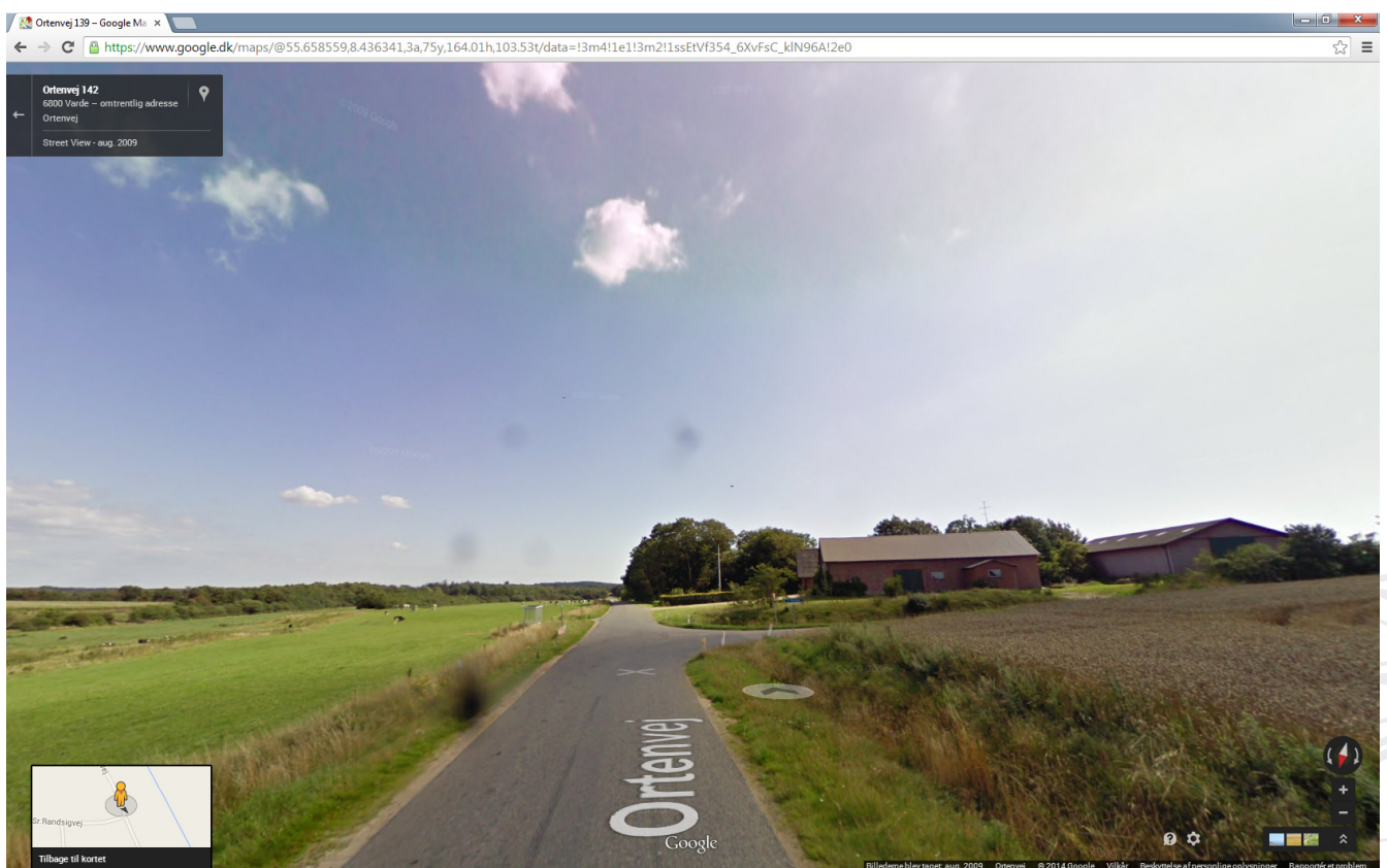
Figur 3: Ansøgte placering set fra nord af Ortenvej mod syd.