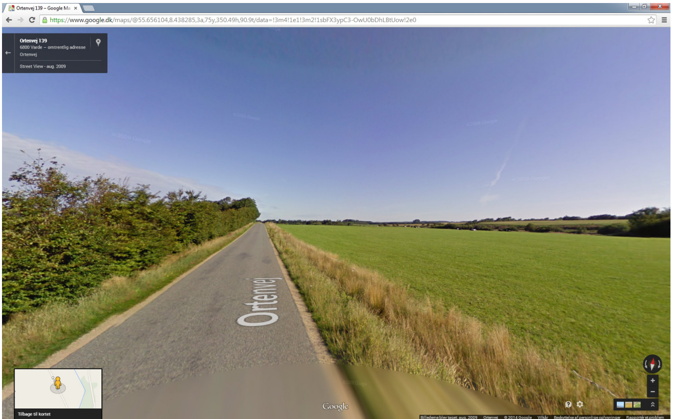
Figur 6: Ansøgte placering fra syd ad Ortenvej mod nord. Kilde Google april 2009.