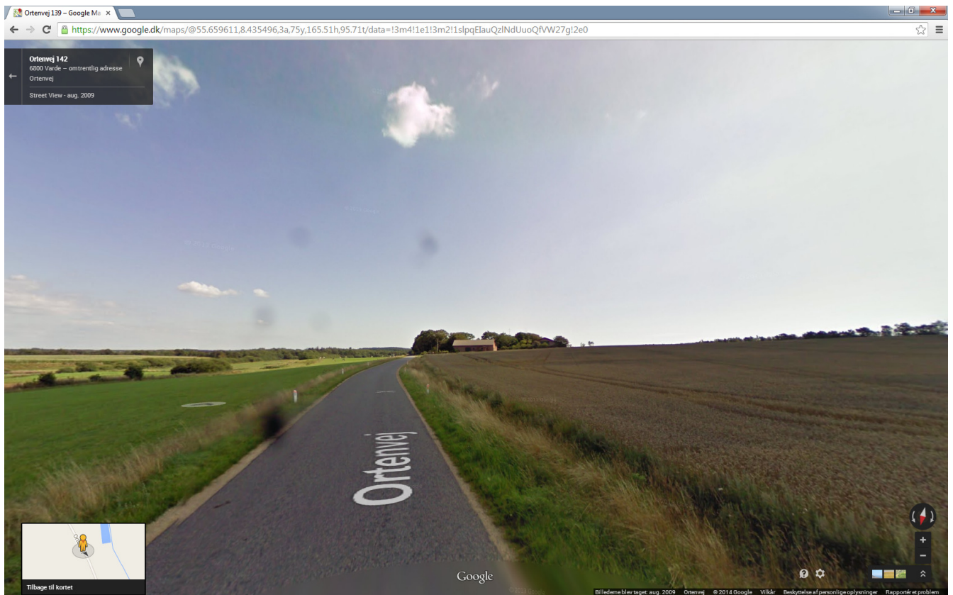
Figur 2: Ansøgte placering set fra nord ad Ortenvej mod syd.