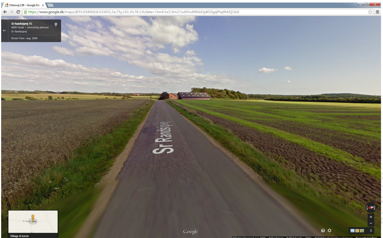
Figur 5: Ansøgte placering fra Vest ad Sr. Randsigvej mod øst. Kilde Google april 2009.